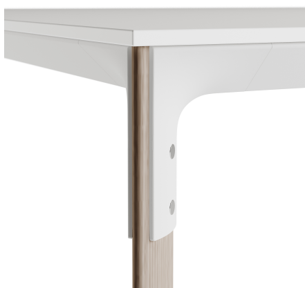
Legs veneered in oak

Gambe impiallacciate in essenza di Rovere