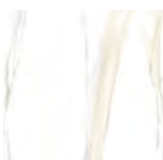
Calacatta gold matte