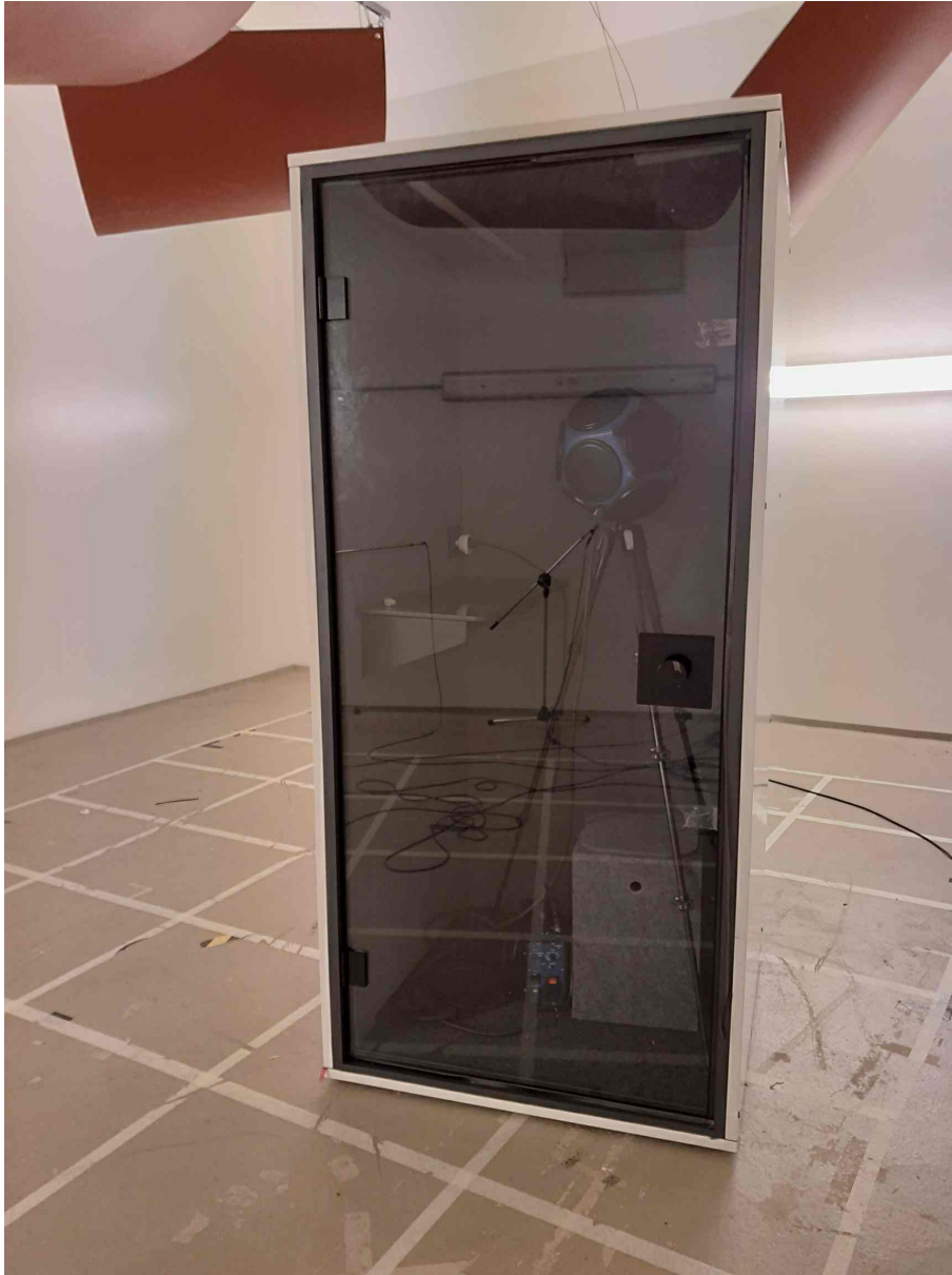
Abbildung 1: Telefonbox Berlin Acoustics FOCUS closed rear