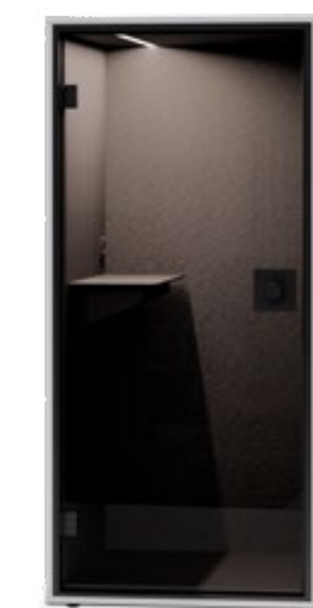
PARETE POSTERIORE CHIUSA