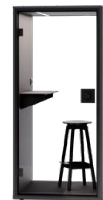
PARETE POSTERIORE IN VETRO