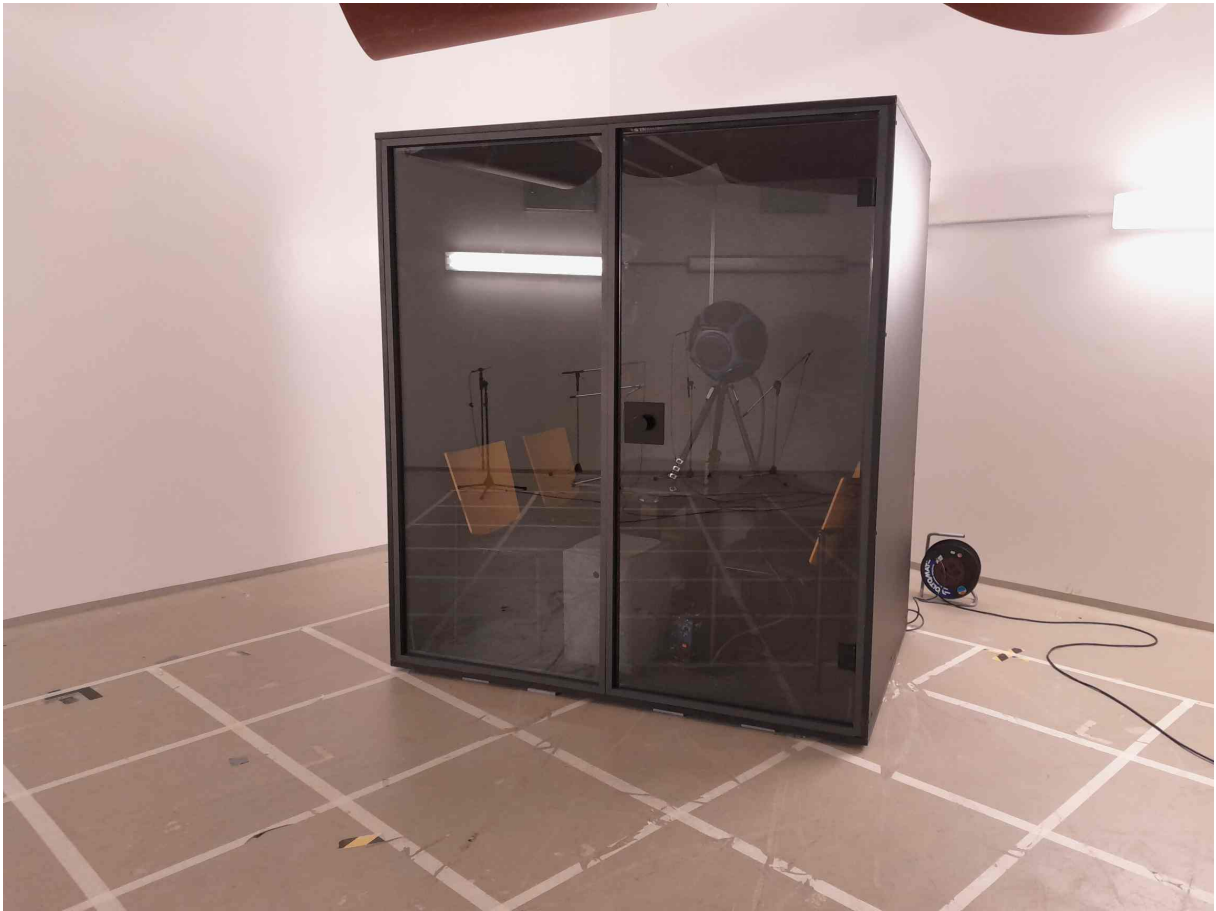
Abbildung 1: Meetingbox Berlin Acoustics MEET closed rear