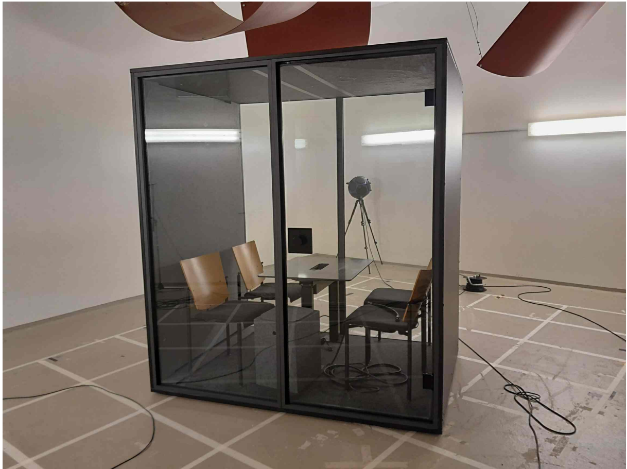
Abbildung 1: Meetingbox Berlin Acoustics MEET glass rear