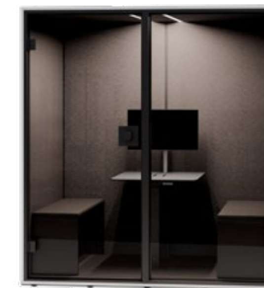
PARETE POSTERIORE CHIUSA