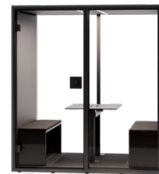
PARETE POSTERIORE IN VETRO